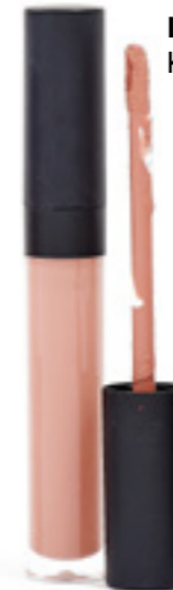
Lesk na rty 02 Kód: 701002