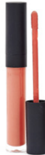
Lesk na rty 20 Kód: 701020