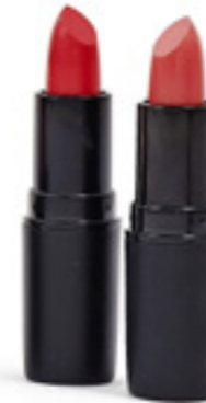
Rtěnka 106 Kód: 701106