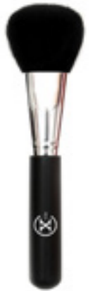
Štětce na pudr 401014